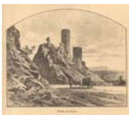
Žebrák od severu