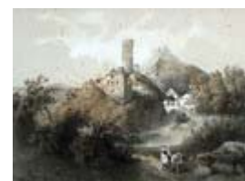
Žebrák a Točnick kolem roku 1850