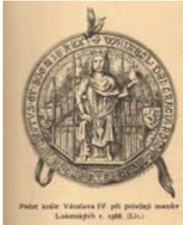
Pečeť Václava IV