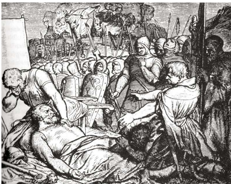
Smrt Jana Žižky, Josef Mánes

Janu Žižkovi se stalo osudným tažení proti Albrechtu Rakouskému v roce 1424. Cestou na Moravu se Žižka rozhodl pro samostatnou akci a oblehl město Přibyslav. Vítězství se už nedočkal. Nedaleko hradeb zemřel 11. října na následky nedolčeného hlíznatého onemocnění. V té době byl už také slepý na obě oči. Místo, kde Jan Žižka skonal, dnes připomíná majestátní mohyla. Stojí v parku u silnice z Přibyslavi na Žižkovo Pole. Jen kousek od památné aleje se vypíná už 150 let.